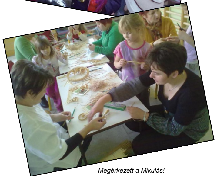
Megérkezett a Mikulás!